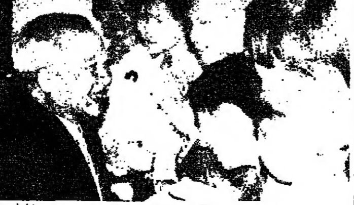
استقبال سيهانوك في طوكيو

وصل الامير نورودوم سيهانوك امس السبت الى طوكيو للمشاركة غدا الاثنين والثلاثاء المقبل في لقاء كمبوديا مع رئيس وزراء نظام بيوم منه حون سين وقال الامير سيهانوك في رسالة نشرتها كبرى الصحف اليابانية اساحي يوم وصوله الى طوكيو انل التوقيع على اتفاق سلام في طوكيو مع حون سين وشدد سيهانوك الذي يتولى رئاسة الحكومة الائتلافية للمقاومة الكمبودية التي تحترف بينا اليابان على انها كمبوديا حرة من اي سيطرة خارجية وعلى اساس نظام منتخب ديمقراطيا